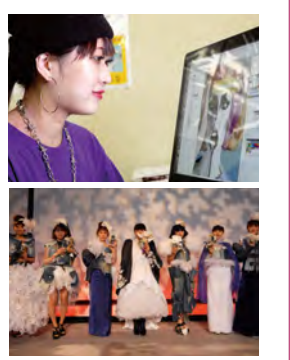
※スケジュール内容は変更になる場合があります。