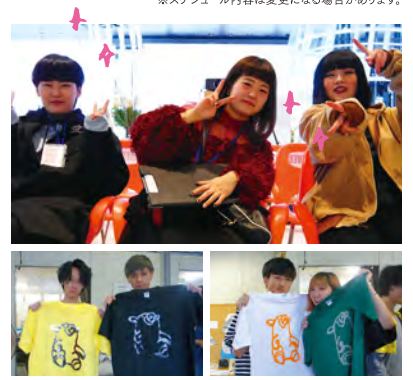
※スケジュール内容は変更になる場合があります。