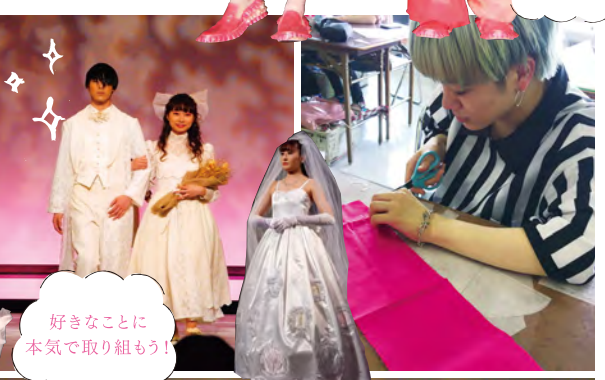
好きなことに本気で取り組もう!