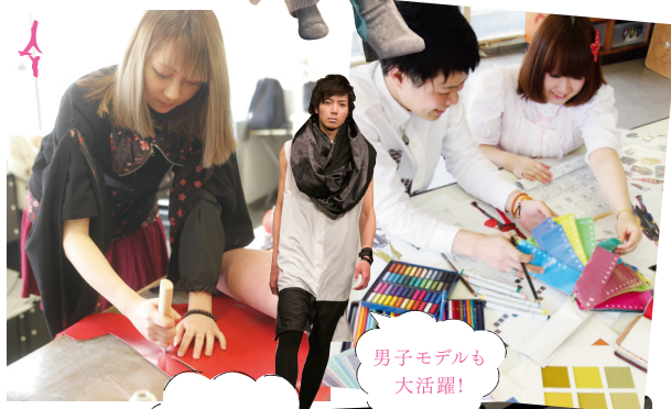
男子モデルも大活躍!