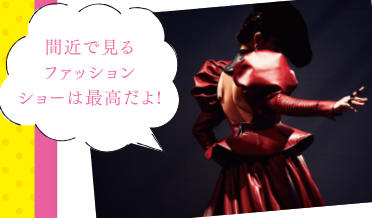
間近で見るファッションショーは最高だよ!