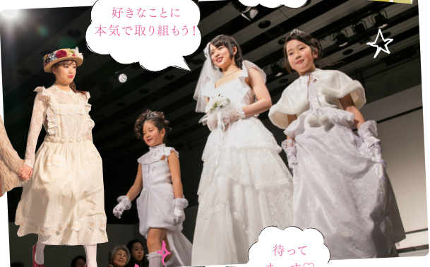
好きなことに本気で取り組もう!